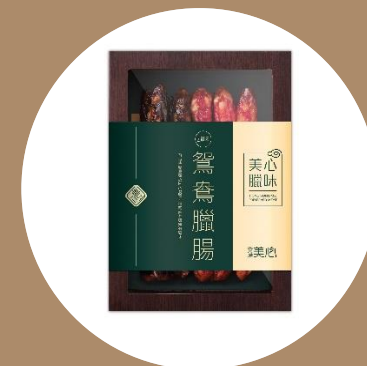
美心鴛鴦臘腸 (10條) MX Preserved Sausage Combo (10 pcs)