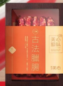
古法臘腸禮盒 (每盒10條)