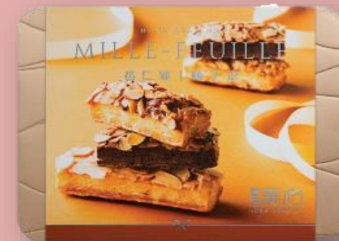
杏仁條榛子條 (19 件) Mille-feuille Gift Set (19 pcs)

甜心酥: 原味 (7件) | 楓糖味 (7件) | 榛子味 (5件) | 椰香 (5件)