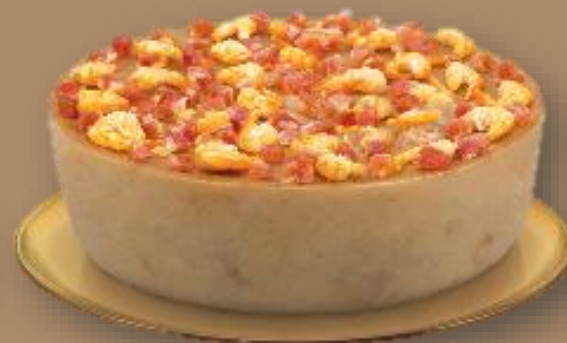
美心 芋頭糕 MX Taro Pudding