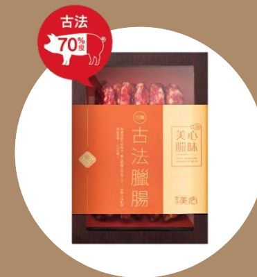
美心古法臘腸 (10條) MX Traditional Preserved Sausage