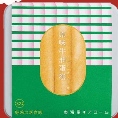
東海堂原味牛油蛋卷 (32條) Arome Original Eggrolls (32pcs)