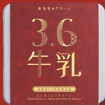
東海堂北海道3.6牛乳蛋白卷 (節日版) (32條) Arome Hokkaido 3.6 Milk Egg White Rolls (32pcs)