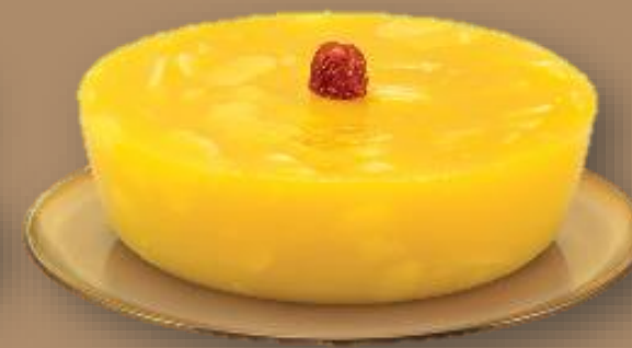
美心 馬蹄糕 MX Water Chestnut Pudding