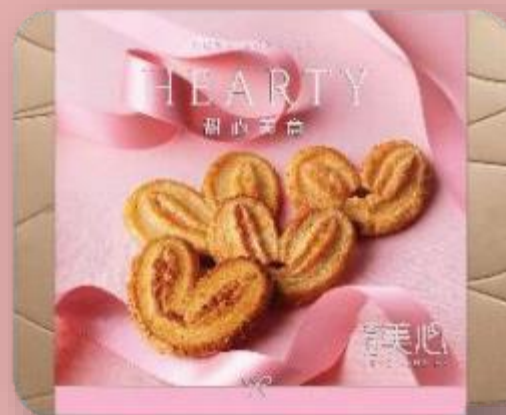
甜心美意 (24 件) Hearty Butter Pastries Gift Set (24 pcs)

甜心酥: 原味 (7件) | 楓糖味 (7件) | 榛子味 (5件) | 椰香 (5件)