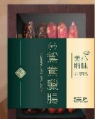
鴛鴦臘腸禮盒 (每盒10條)