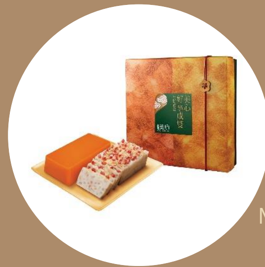
美心好事成雙 年糕禮盒 MX Chinese Pudding Twin Set