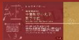
東海堂 十勝紅豆小丸子栗子糕 Arome Tokachi Red Bean Rice Ball Chestnut Pudding