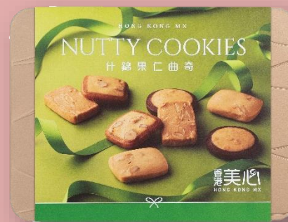
什錦果仁曲奇 (28 件) Nutty Cookies (28 pcs)

杏仁曲奇 (6件) | 榛子曲奇 (8件) | 夏威夷果仁曲奇 (8件) | 腰果曲奇 (6件)