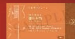
東海堂 椰汁年糕 Arome Coconut Milk Pudding