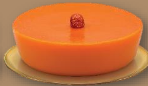
美心 椰汁年糕 MX Coconut Milk Pudding