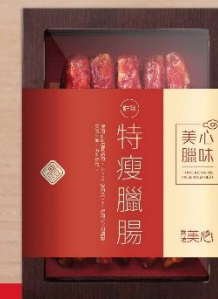
特瘦臘腸禮盒 (每盒10條)