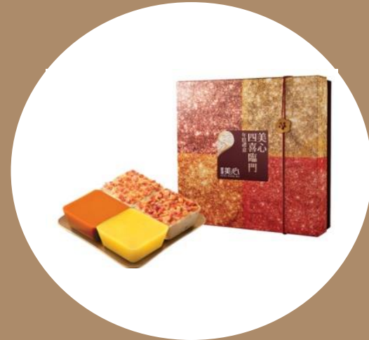
美心四喜臨門 年糕禮盒 MX Chinese Pudding Collection