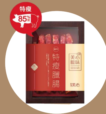
美心特瘦臘腸 (10條) MX Preserved Sausage (10 pcs)