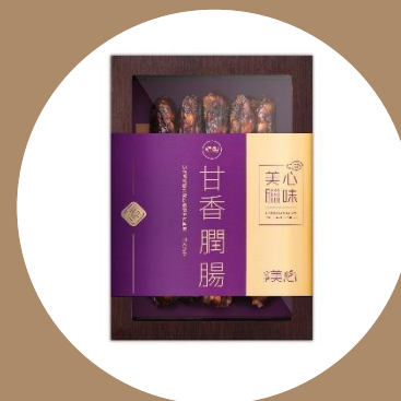
美心甘香臘腸(10條) MX Preserved Liver Sausage