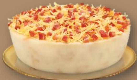
美心 瑤柱蘿蔔糕 MX Turnip Pudding with Conpoy