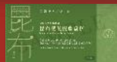
東海堂 昆布櫻花蝦蘿蔔糕 Arome Kombu Sakura Shrimp Turnip-Pudding