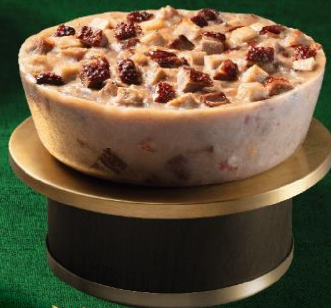
新口味 雙喜燒鵝芋頭糕