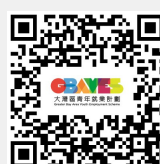
大灣區青年就業計劃網頁