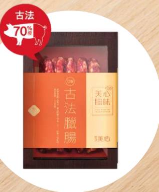
美心古法臘腸 (10條) MX Traditional Preserved Sausage