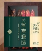
鴛鴦臘腸禮盒 (每盒10條)