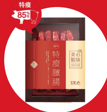
美心特瘦臘腸 (10條) MX Preserved Sausage (10 pcs)