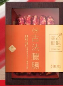
古法臘腸禮盒 (每盒10條)