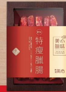
特瘦臘腸禮盒 (每盒10條)