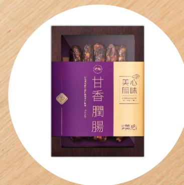
美心甘香臘腸(10條) MX Preserved Liver Sausage