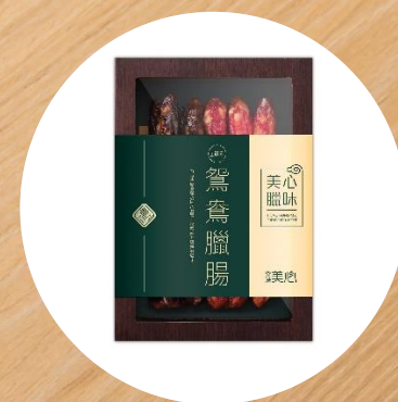
美心鴛鴦臘腸 (10條) MX Preserved Sausage Combo (10 pcs)