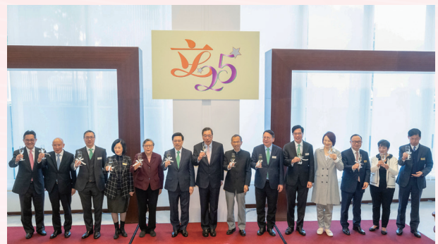
與行政長官、行政會議成員及政府高級官員午宴