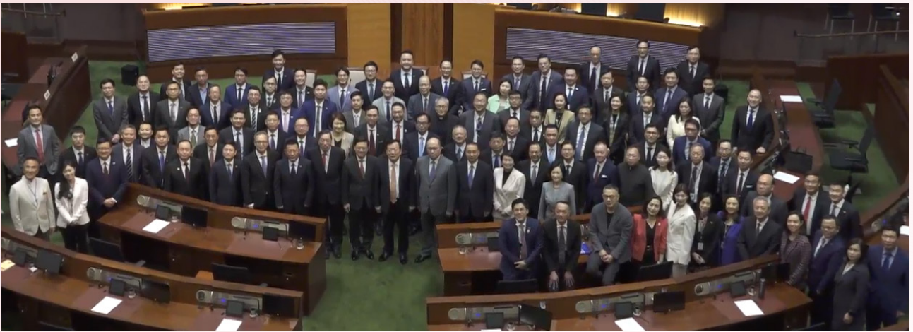
與中央港澳辦主任交流