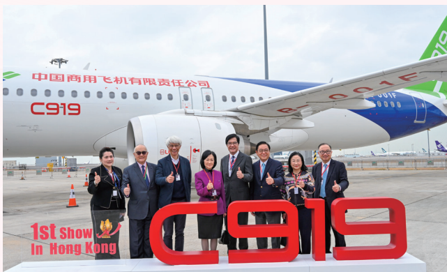
參觀國家自主研製的 C919 及 ARJ21 飛機