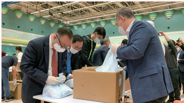
2022-3-30 於香港公園體育館，為 G19 及其他包裝抗疫包的義工打氣