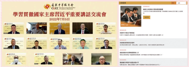
2022-7-5 學習貫徹習近平主席重要講話