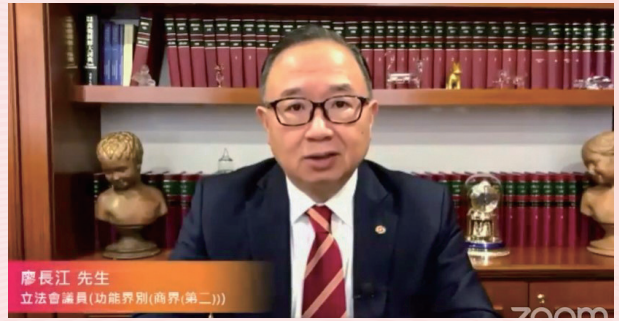
2022-7-19 青年委員會慶祝香港成立 25 周年研討會專題演講：愛國者治港，立法與行政關係的展望