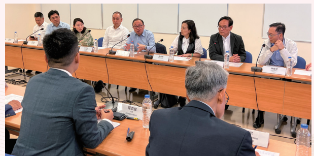
與澳門衛生局官員座談