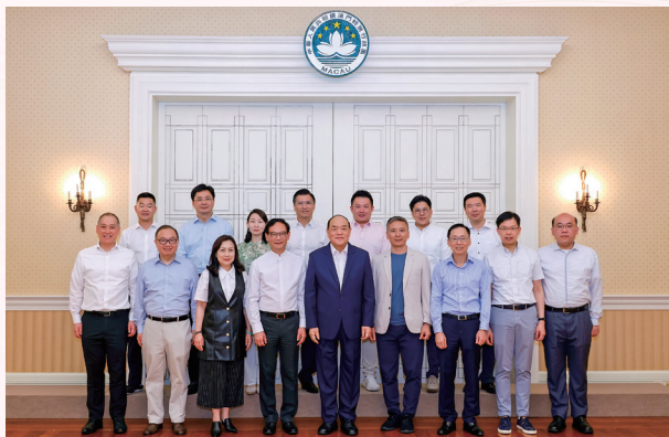
2023-6-3 G19 議員與澳門行政長官會面

們會優化並希望盡早公布的另一項措施，是有關內地投資者在「南向通」下可以購買的投資產品。據我們向業界了解所得，「南向通」投資者對多元化的資產配置感興趣，對基金產品存在需求，特別是股票基金。這是我們希望優化的方向之一，以期納入大部分在香港註冊成立、並且經香港證監會認可的低至中風險、非複雜的基金。至於高風險基金，我們希望在納入「南向通」投資者有一定投資經驗的產品後（例如大灣區的股票基金），才作出整體考慮。