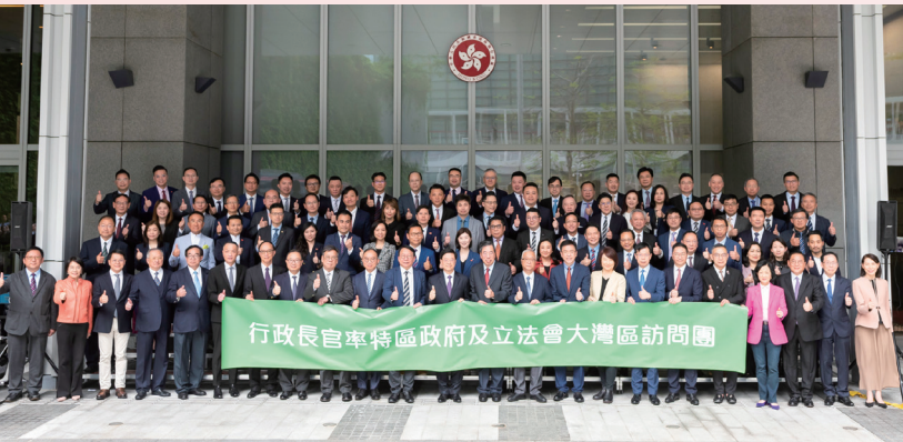
2023-4-21 至 2023-4-24 行政長官率領政府及立法會訪問大灣區