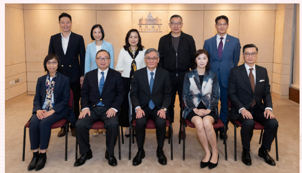
立法會司法及法律事務委員會參觀金鐘高等法院大樓