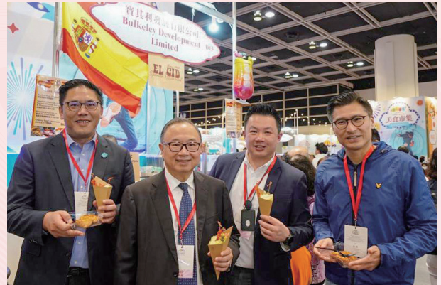
參觀宣傳 HELLO HONG KONG 美食市集