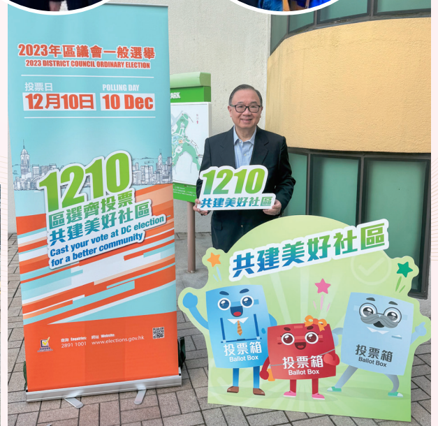
積極投票 履行義務