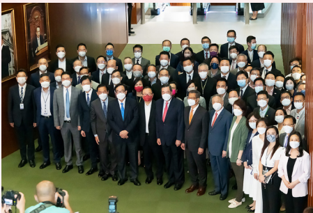
2022-10-5 交流課題包括：(a) 金融服務；(b) 土地供應及發展；(c) 房屋供應；(d) 運輸及物流；(e) 經濟發展；及 (f) 創新科技