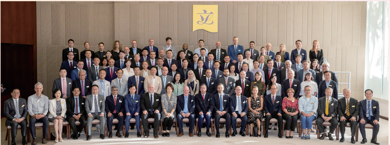
與駐港總領事和名譽領事會晤