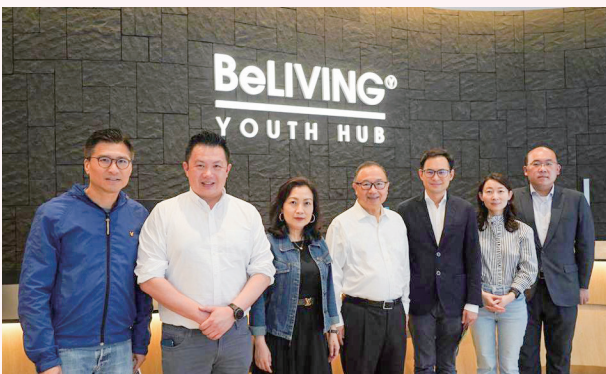
2023-4-29 參觀灣仔摩理臣山道 BelIVING Youth Hub

政府回應： 資助計劃要求青年租戶承諾為鄰里社區提供社區拓展服務，例如為基層家庭兒童輔導功課，及音樂、藝術或體育培訓，從而培養青年宿生對社會的認同感和責任感，建立主人翁的意識。青年宿舍所在的社區亦會受益於青年宿友提供的地區服務，令弱勢社群得到青年人的直接幫助。因此，資助計劃不單是一個青年住宿的項目，而是一個青年發展的項目。