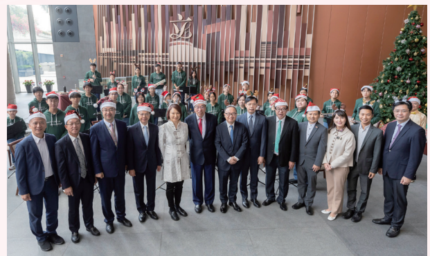
觀看學生於立法會綜合大樓的午間音樂表演