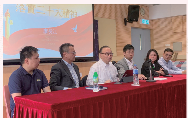
參加紀律部隊評議會（職方）研討營 講解二十大精神