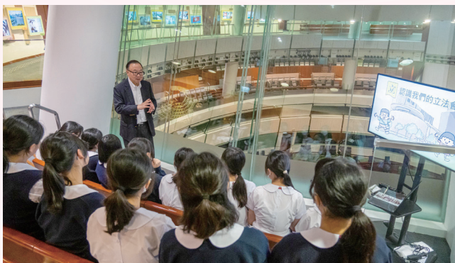
參與為學校舉辦的實體導賞團和教育活動