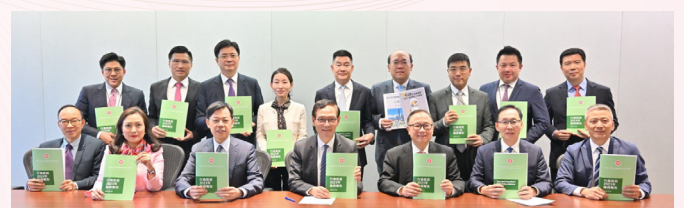
2023-10-25 G19 施政報告見傳媒