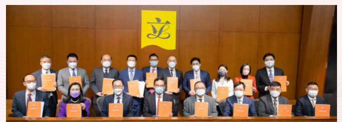
2023-2-22 G19 財政預算案記者會