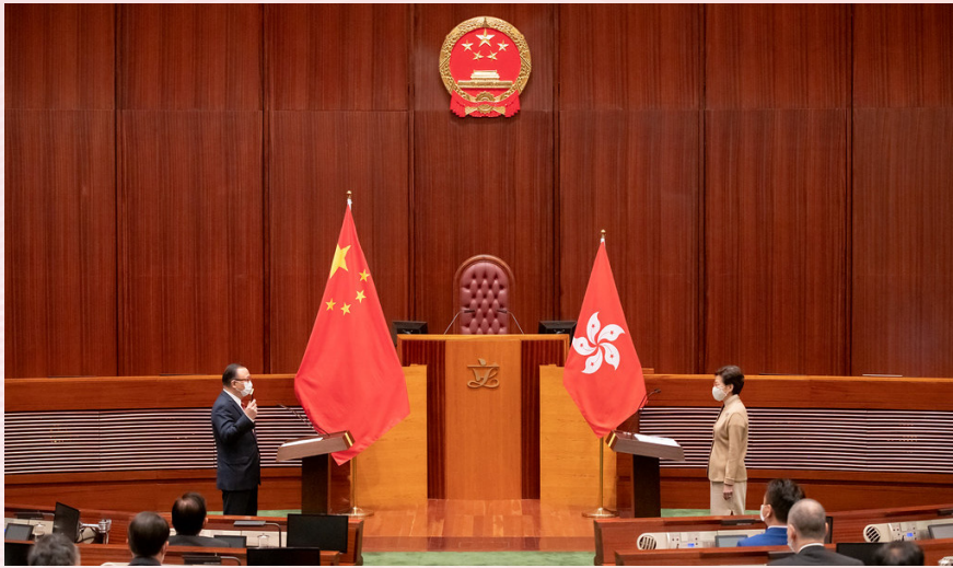
2022-1-3 宣誓就職 第七屆立法會議員