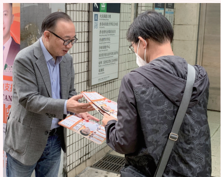
落區呼籲市民投票