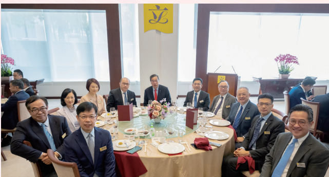
與中央人民政府駐香港特別行政區聯絡辦公室主任及官員午宴