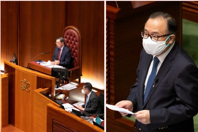
2022-6-9 詢問「一國兩制」發展