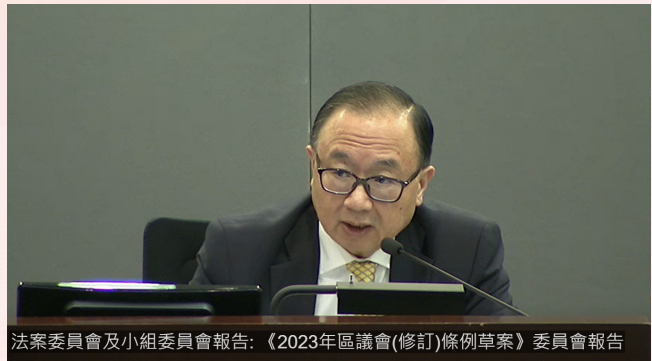
法案委員會及小組委員會報告：《2023 年區議會（修訂）條例草案》委員會報告

2023 年 5 月 12 日至 6 月 13 日，小組委員會連同法案委員會，合共舉行了 11 次會議，約 22 小時。2023 年 7 月 6 日立法會三讀通過《條例草案》。