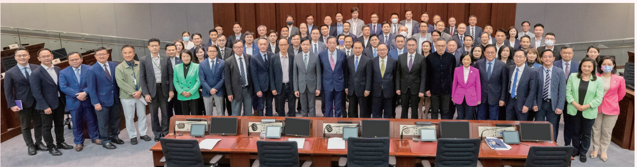
外交部駐港公署特派員講座