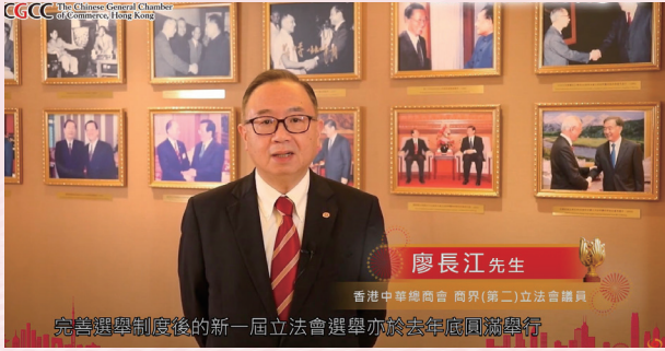
2022-5-1 中總與香港同行 25 載訪問