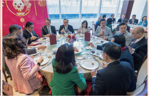
立法會大合照及新春午宴