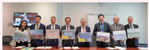
2023-7-6 G19 議員出訪珠海及橫琴記者會