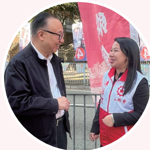
與區議會候選人交談地區情況