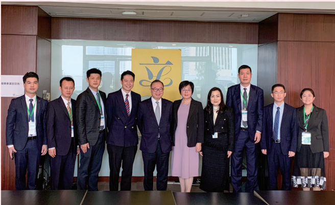
深圳市司法局人員到訪立法會