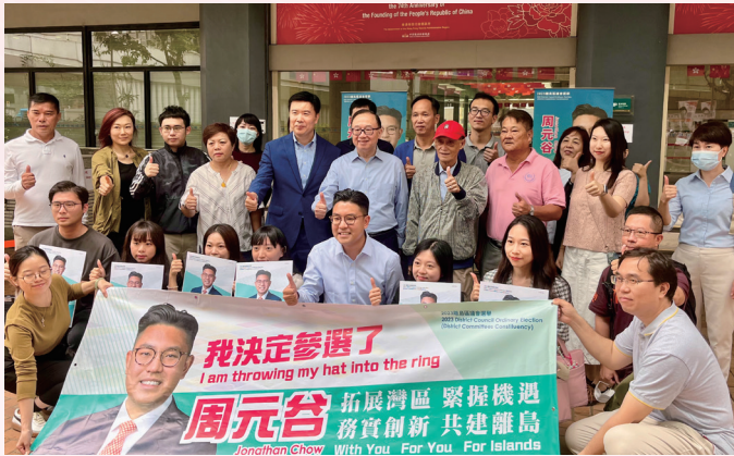
為區議會候選人打氣