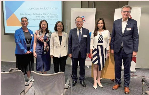
2023-7-1 用英文向澳洲商會和澳洲及紐西蘭特許會計師會講解二十大與兩會帶來的機遇