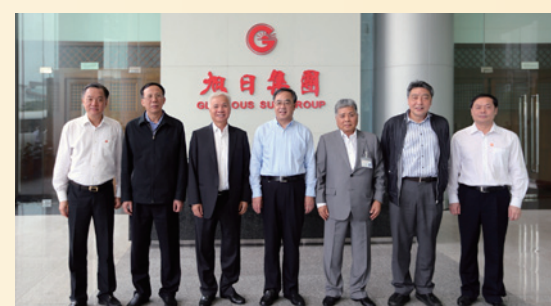
▲ 2014年，時任廣東省省長胡春華（中）聯同時任惠州市書記陳奕成（左1）到訪旭日集團惠州總部。