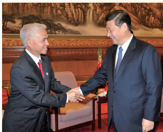
▲ 2011年，時任國家副主席習近平會見楊釗，兩人親切握手。